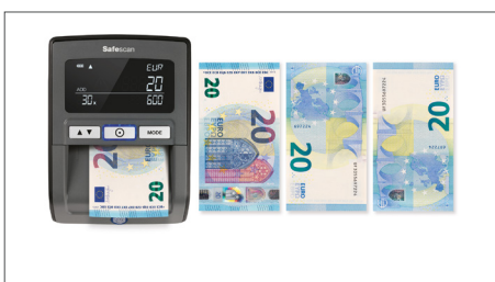
Euro-Banknoten können in beliebiger Richtung eingelegt werden