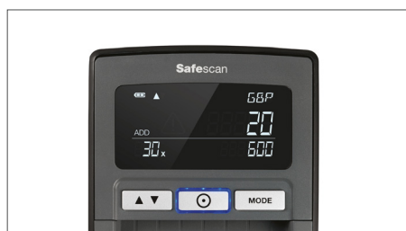
Zeigt Menge und Gesamtbeträge