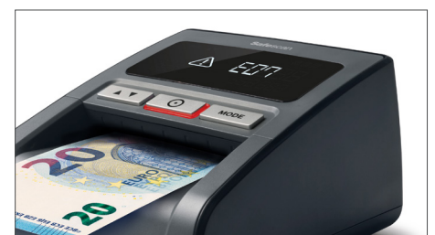
Akustisches und visuelles Alarmsignal